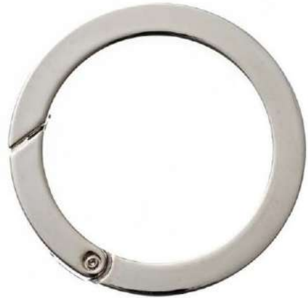
No.133 キャストカラビナ 丸(バフ磨き) 50mm