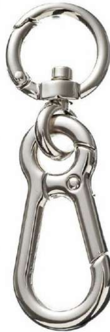
A2400 カラビナ (回転鉤付)