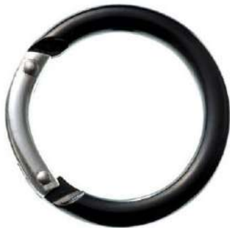
丸型アルミカラビナ(小)