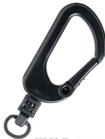
KB50-T 樹脂カラビナ (JP-2+KH-R)