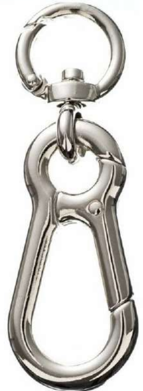
A2401 カラビナ (回転鉤付)