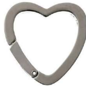
No.134 キャストカラビナ ハート(バフ磨き) 34mm