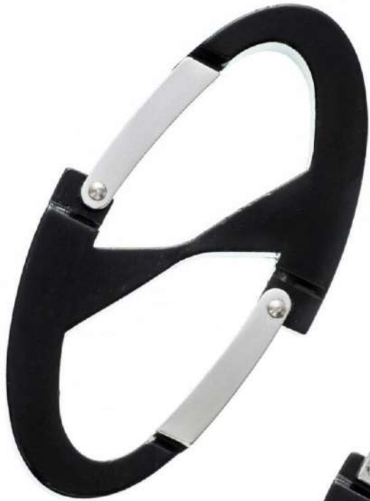
Wフックアルミカラビナ(大)