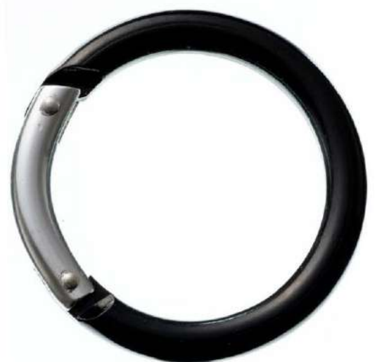
丸型アルミカラビナ(大)