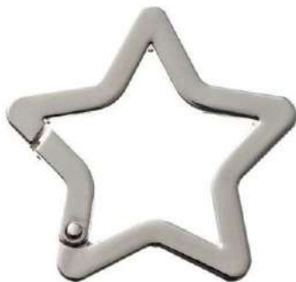
No.135 キャストカラビナ 星(バフ磨き) 40mm