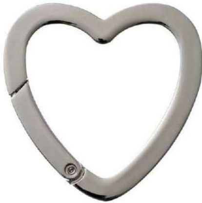
No.134 キャストカラビナ ハート(バフ磨き) 50mm