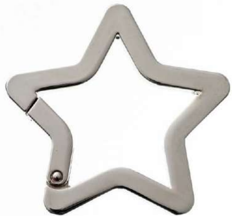
No.135 キャストカラビナ 星(バフ磨き) 58mm