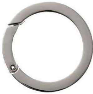
No.133 キャストカラビナ 丸(バフ磨き) 35mm