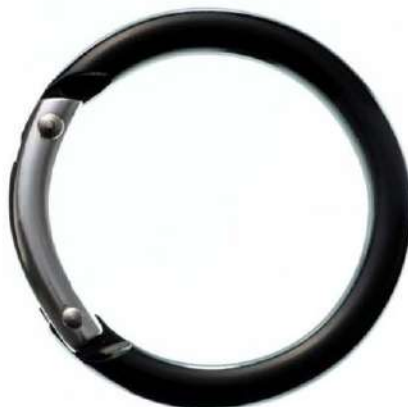
丸型アルミカラビナ(中)