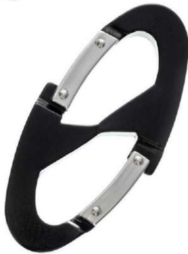
Wフックアルミカラビナ(小)